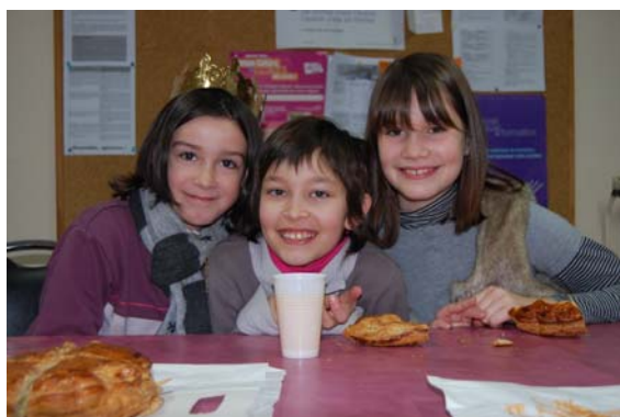
Galette des rois