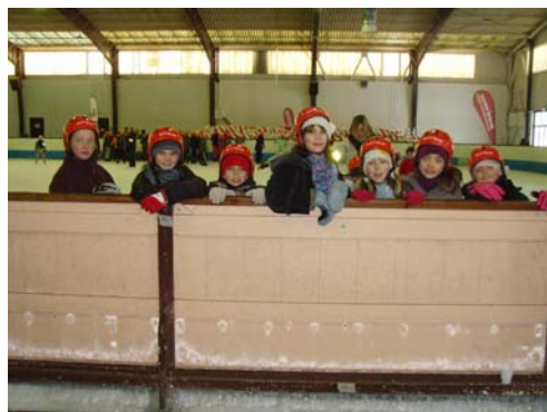
Ecole des champions : ateliers sportifs et citoyens