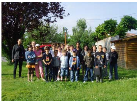
Visite Avenance restauration scolaire