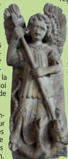
St-Martin terrassant le dragon

Par ailleurs, le service Régional de l'Inventaire s'est beaucoup investi sur l'histoire de Malzéville et a réalisé des études sur le cimetière, l'ancienne Chapelle Saint-Gauzelin, la salle des Fêtes du Jéricho et l'église Saint-Martin.